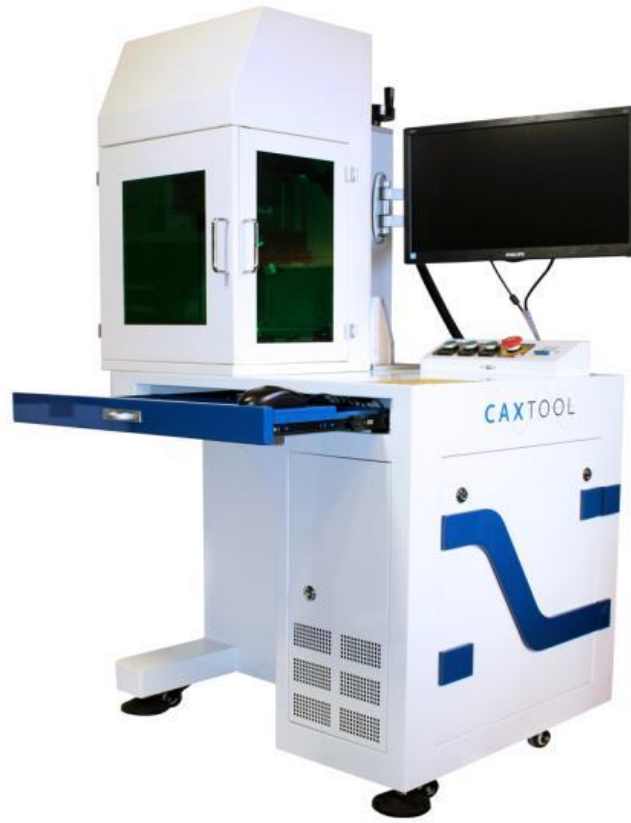
Kép: Fiber lézer jelölő galvo fej / Fiber laser marking galvo head

Adószám: 12871856-2-06 Adószám: HU 12871856 Bankszámla száma: 57600101-11102986 SWIFT (BIC): TAKBHUHB IBAN: HU65 57600101 11102986 00000000 cégjegyzékszám: 06-09-014002 info: